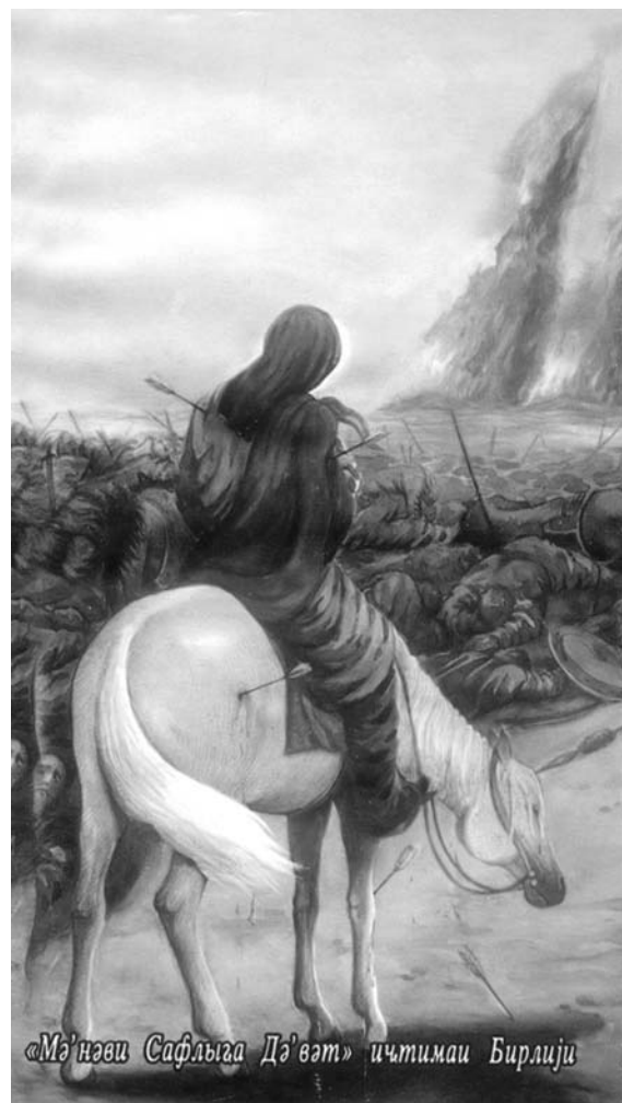
«Мә'нәви Сағлығы Дә'вәт» ичтимаи Бирлији

Һәғигәтән, Исламын мејдана кәлмәси Һәзрәт Мүһәммәд (с) илә, галыб давам етмәси исә Имам Һүсејн (ә) иләдир.